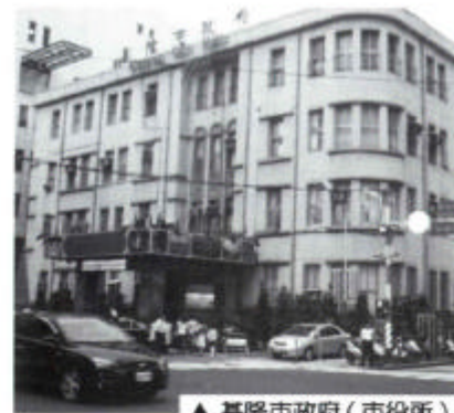
▲基隆市政府（市役所）

基隆市は、宮古島からおよそ420km。台湾の最北部に位置している観光貿易都市です。北は海を臨み、残る三方を山に囲まれた地形をとっており、市の95%は丘陵地となっています。市内にある基隆港は北台湾最大の天然の良港で、市の産業を牽引し、都市の発展に大きな影響を与えています。