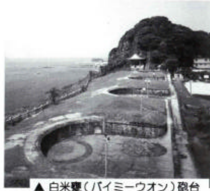
▲白米豊(パイミーウオン)砲台

現在、基隆市は40万人近い人口を抱える大都市となり、台湾の中心都市の一つとして成長を続けています。